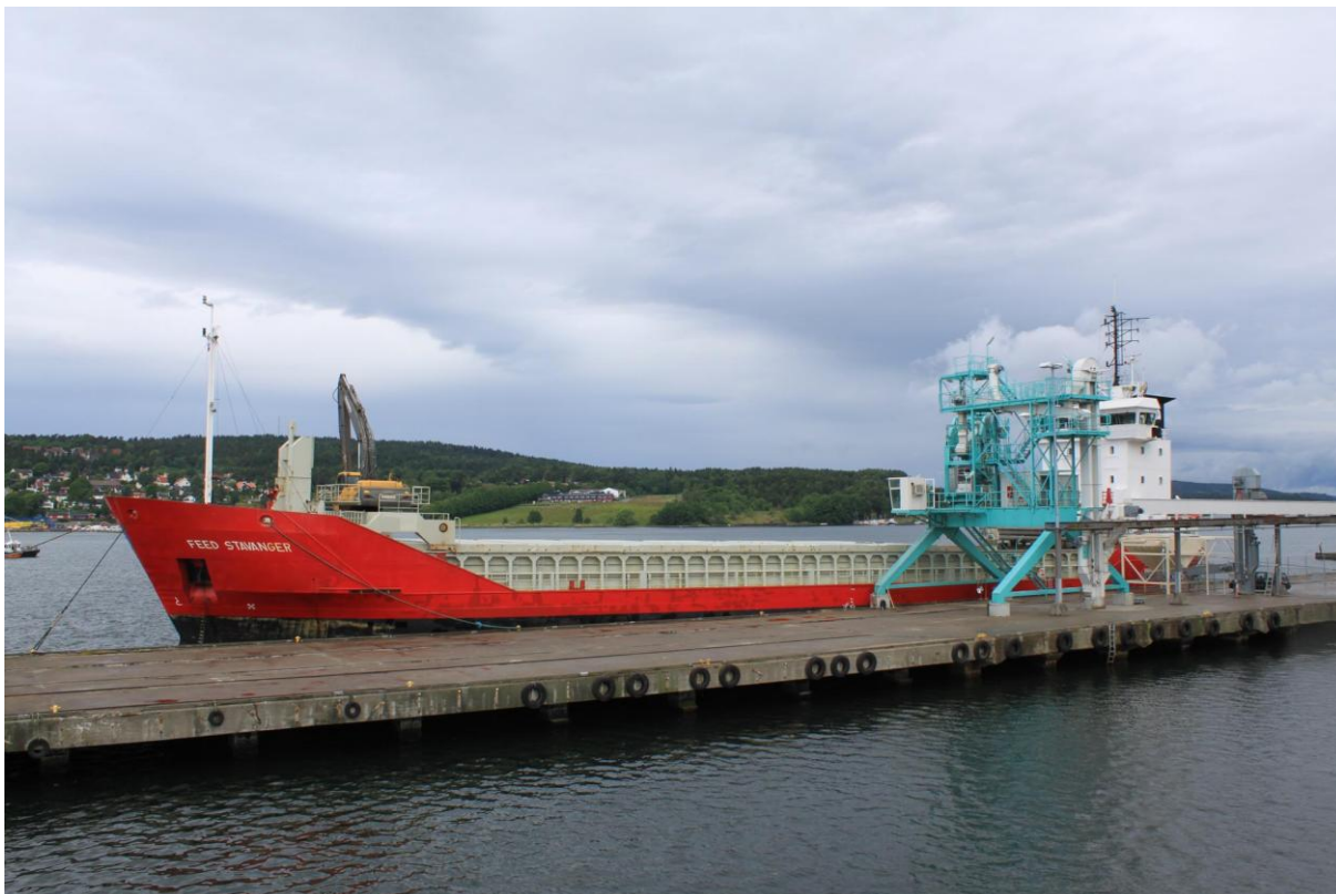
Lasting av korn ved Lantmännen Cerealia i Moss som skal til Fiskå Mølle på Fiskå.